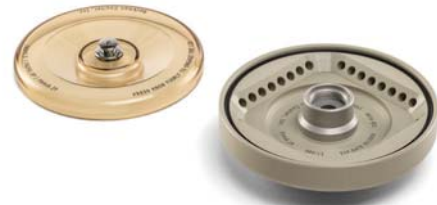
FA4X8.2P プラスチックロータ BIOC

最大回転数：15,000 rpm 最大遠心力：20,627 xg 24本×1.5 / 2.0 mL