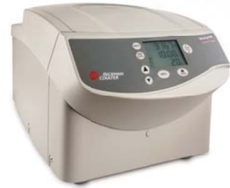
Microfuge 20R (冷却モデル)