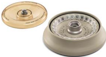
FA241.5P プラスチックロータ (標準付属)