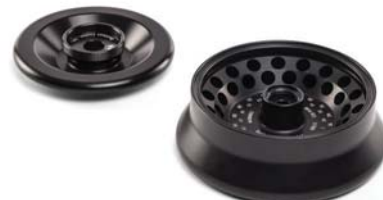
FA361.5 アルミニウムロータ

最大回転数：15,000 rpm 最大遠心力：20,627 xg 24本×1.5 / 2.0 mL